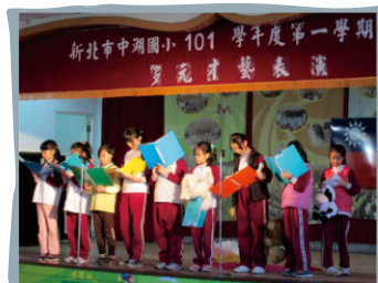
多元才藝表演-英語朗讀