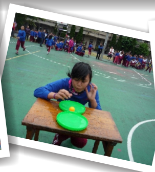
交通安全教育宣導