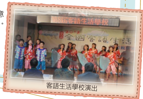
客語生活學校演出