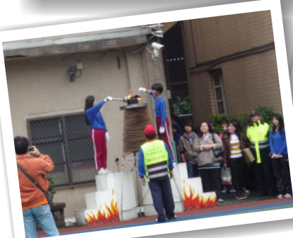
元宵節猜燈謎活動