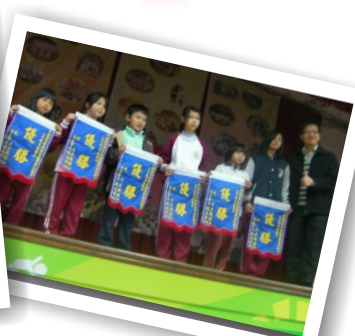
校內藝術美學教育